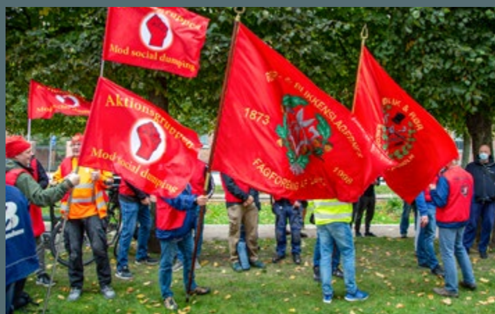
SEPTEMBER: Protest mod social dumping på Femern.