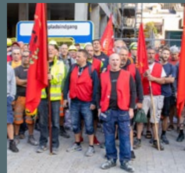
JUNI: Manifestation i Carlsberg Byen, hvor Züblin opførte Dahlerup Tårnet med massiv social dumping.