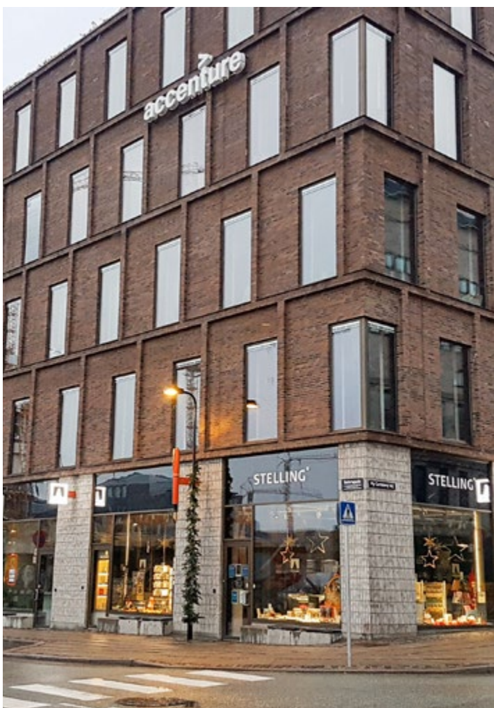
Det var her på Harild Hus, at et større sjak hos det nu lukkede CR Construction valgte at skære et lille sjak ud af akkorden, da der skulle udbetales akkordfortjeneste.

Sagen bliver lukket med forbehold om, at den kan genoptages, hvis der fremkommer nye oplysninger, der kan dokumentere, at der er tale om én fællesakkord, og ikke to, som virksomheden fastholder.