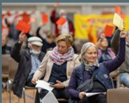
NOVEMBER: Generalforsamlinger i BJMF med dankvand, håndsprit, afstand og mundbind.