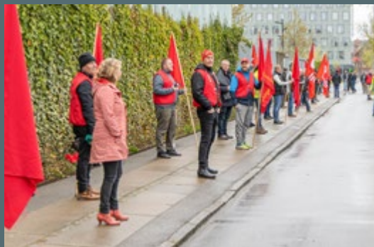
MAJ: Hold afstand-demonstration foran Bachgruppens byggeplads på Islands Brygge med krav om corona-karantæne til udenlandske kolleger, der rejser ind i landet.