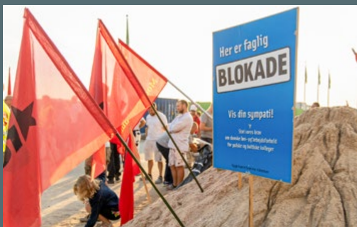
AUGUST: Faglig blokade imod Dansk Totalentreprise i Hedehusene.