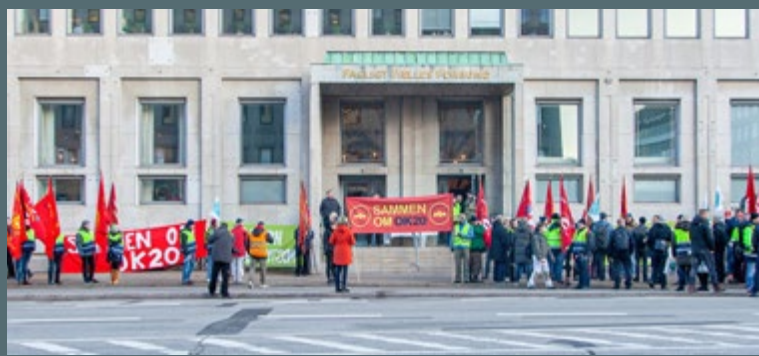
FEBRUAR: OK20-forhandlinger på det grønne område går i gang. Under sloganet Sammen om OK20 er en række andre fag mødte frem i solidaritet.