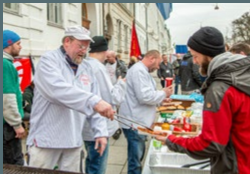
MARTS: OK20. Opbakningen fortsætter foran Forligsen. Men desværre vælger forhandlerne senere at indgå forlig under henvisning til coronapandemien.