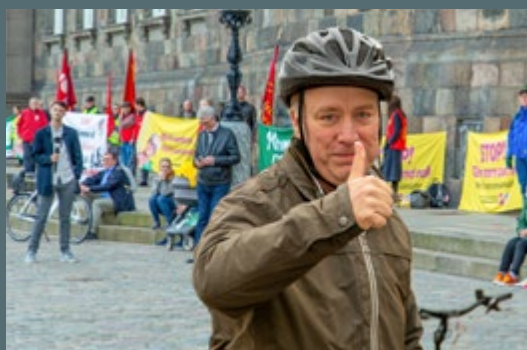
OKTOBER: Folketingets åbning med krav om pensionsalder på 68 og bedre normering i institutionerne.