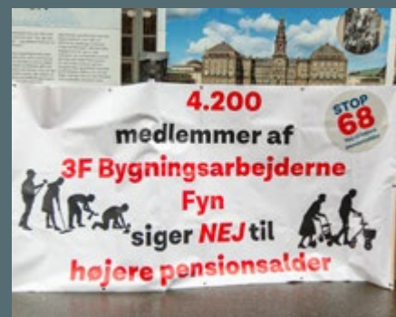
DECEMBER: Protest foran Christiansborg mod at hæve pensionsalderen.